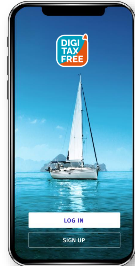
Мобильное приложение DigiTaxFree