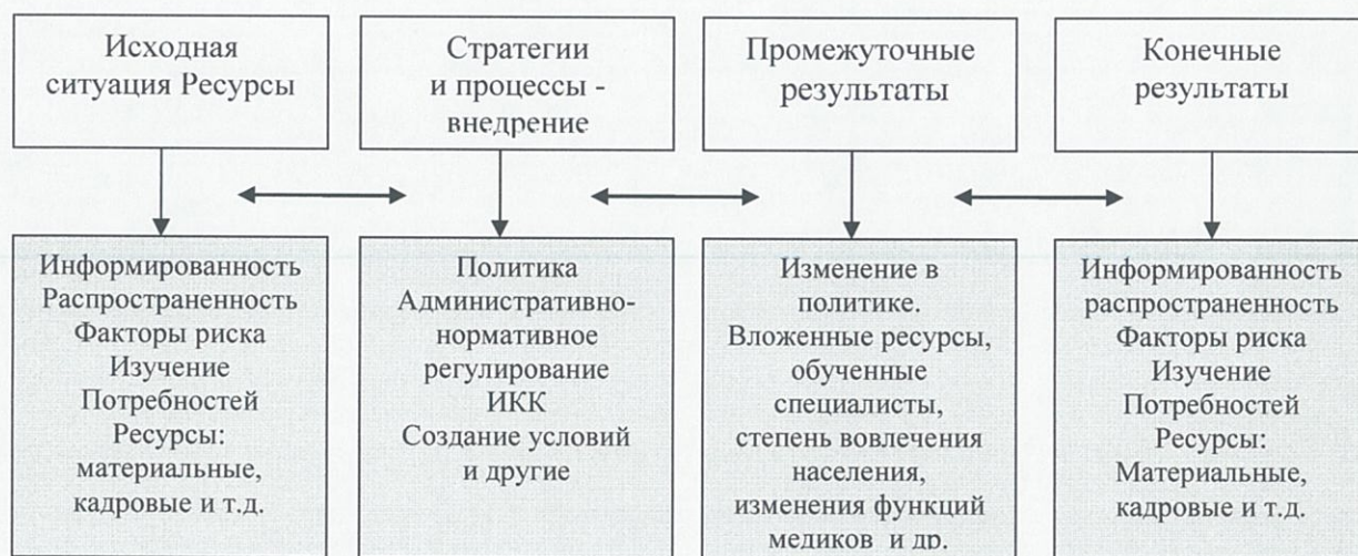
Схема оценки программы

Система показателей оценки эффективности реализации Программы представляет собой алгоритм оценки фактической эффективности в процессе и по итогам реализации Программы, и основана на оценке ее результативности с учетом объема ресурсов, направленных на ее реализацию, не парированных рисков и достигнутых результатов, оказывающих влияние на изменение соответствующей сферы социально-экономического развития Дальнереченского городского округа.